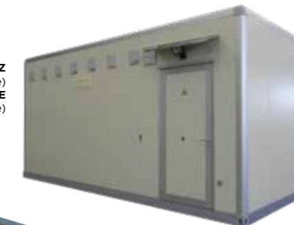
Shelter léger BASALTE & QUARTZ (métallique) Shelter léger ARDOISE (thermoplastique)