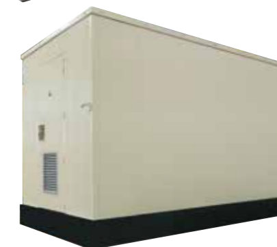
Shelter mixte GYPSE (béton/métallique ou béton/thermoplastique)