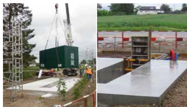
Maîtrise d'oeuvre travaux