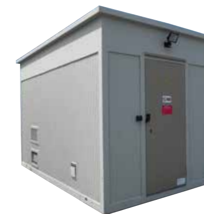
Shelter lourd GRANIT (béton)