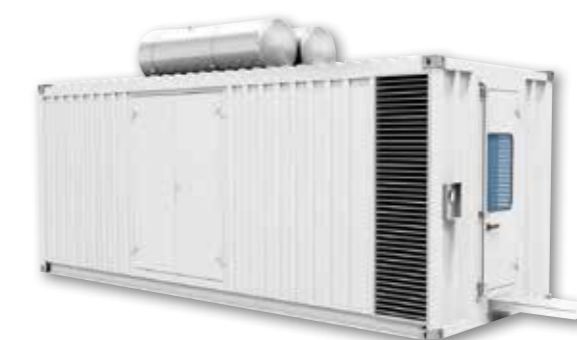
Shelter industriel TOPAZE (mécano-soudé)