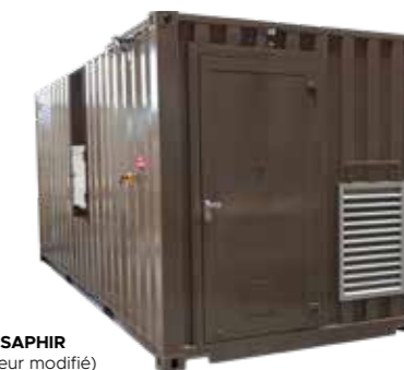
Shelter SAPHIR (conteneur modifié)